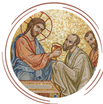
Мозаичная композиция «Евхаристия» в храме Покрова Пресвятой Богородицы в Ясеневе г.Москвы

с полуночи накануне перед Причастием ничего не едят и не пьют, ибо принято приступать к Святой Чаше натощак. В дни праздничных ночных служб (на Пасху, Рождество Христово и т.д.) следует помнить, что продолжительность литургического поста, по определению Священного Синода РПЦ 1969 года, составляет не менее 6 часов.