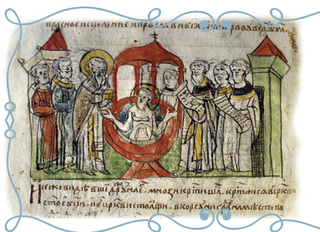
Крещение князя Владимира. Миниатюра из Радзивиловской летописи

Среди тех, кто оказался таким образом отсечен от Церкви, были те, кто желал исказить полученную от апостолов веру и вместо истины учить других собственным выдумкам. Сам Господь Иисус Христос предсказывал появление таких лжеучителей. Чтобы указать отличие от всех фальшивых «церквей», созданных смертными людьми, истинная Церковь, основанная Богочеловеком Христом, приняла уточняющее название – Православная, что означает: «правильно славящая Бога». Глубоко осознаем, какое сокровище веры нам вверено Богом, и обратимся ко Христу, возненавидим грех и станем христианами – верными чадами нашей Матери-Церкви! ■