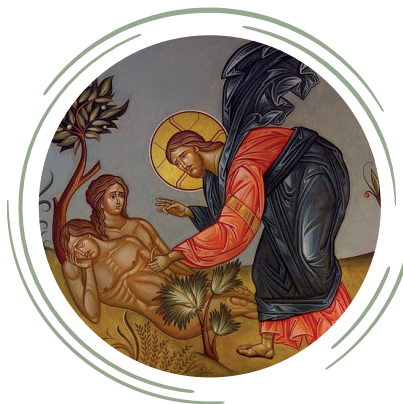
Иисус Христос, Адам и Ева

кресте за наши грехи, – примирил нас с Собою. Спасение, совершенное Господом Иисусом Христом, – это избавление каждого из нас от рабства дьяволу, греху и смерти и дарование нам вечной жизни в общении с Богом. «Я пришел для того, чтобы имели жизнь и имели с избытком», (Ин.10;10) – говорит Христос. И эта жизнь с избытком начинается здесь. Но что для этого нужно?