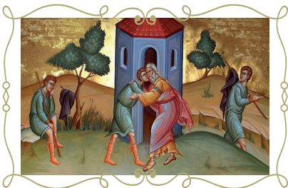
Возвращение блудного сына

Молитва разрешения (прощения) грехов читается священником над покаявшимся. Если у человека нет и намека на покаяние, если он не собирается отказать от своей греховной жизни, то такая Исповедь будет недействительной.